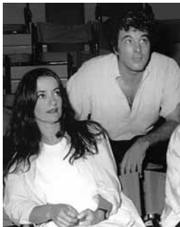
Από τις πρόβες της «Νίκης» της Λούλας Αναγνωστάκη, 1986.